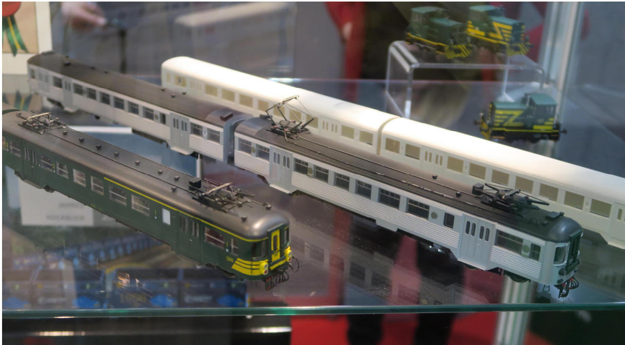
Dans la vitrine de B-Models les nouvelles automotrices du programme 2019 Au centre de l'Image, l'Automotrice « Budd » Nürnberg le 31/01/2019