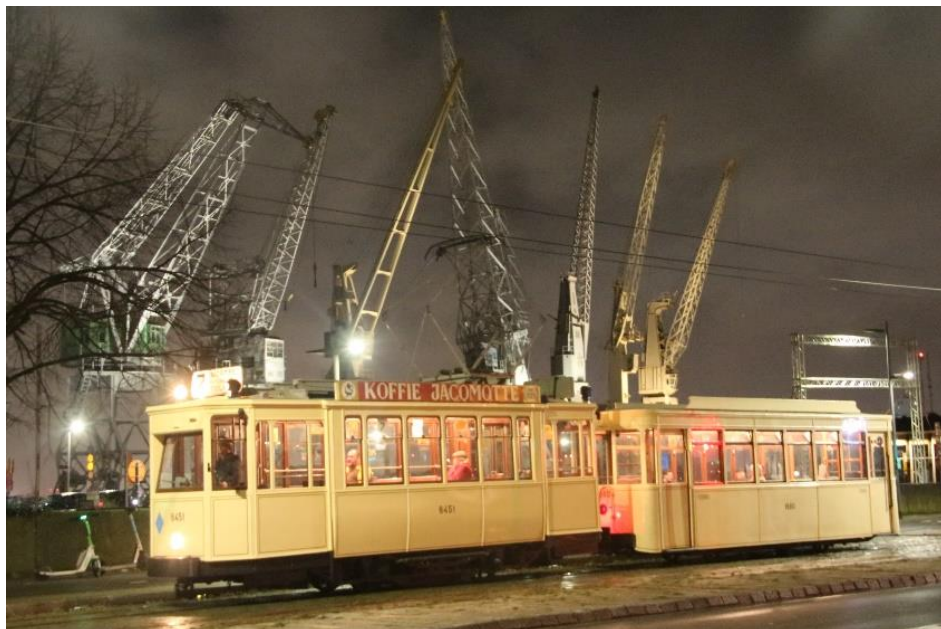
Rijnkaai. Een museumtram met museumkranen.