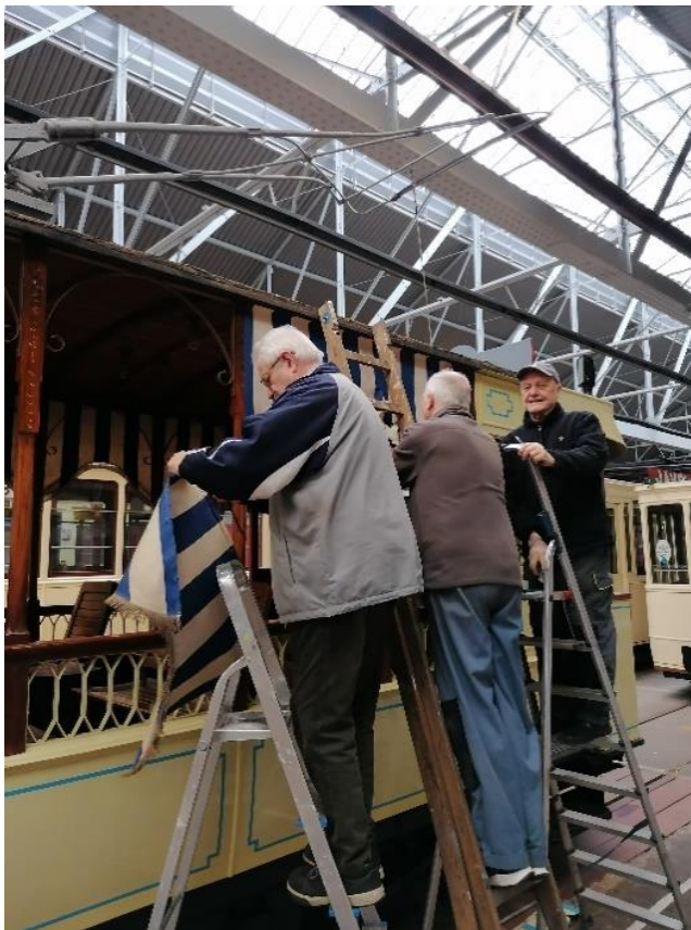
Vandalen? Laddermannen!

Dat brengt ons bij de Gentse 216. We vervangen de guirlandes en de beplating erboven die nogal groezelig waren. Leo heeft één stuk gewassen zodat Luc de juiste kleur blauw heeft om nieuw zeildoek te laten maken. We hebben wel geconstateerd dat de toestand van het dak en de dakrand er niet al te best bij ligt. Hij wordt eveneens herschilderd en zal zeker een topstuk zijn op de Gentse tramparade. Daar zullen ook de drieasser 328 en bijwagen 55 aanwezig zijn.