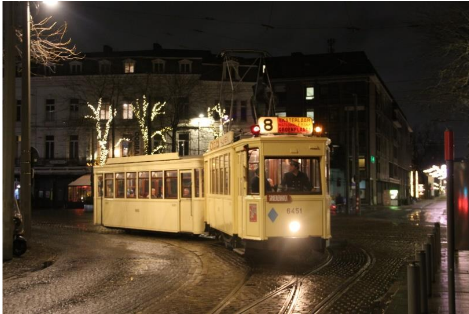
Leopoldplaats. Door die bocht kraste lijn 8 meer dan een eeuw lang!